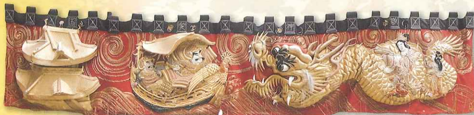
旧水引幕(滑原町屋台)

本展では、岩壺神社の秋季例大祭に奉納される屋台の 水引幕や高欄掛けといった屋台衣裳とともに、三木市有 宝蔵文書などの歴史資料を通じて、秋祭りと祭り屋台を めぐる民俗誌をご紹介します。