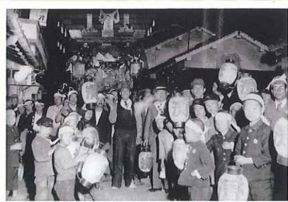
戦時中の滑原町屋台