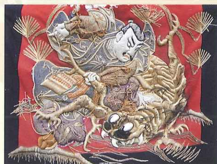
旧高欄掛け(滑原町屋台)