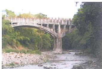
【御坂サイフォン橋】