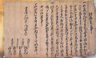
神鑑定之事 (若宮神社畑座所蔵)