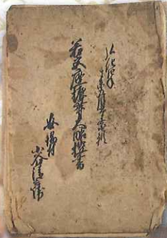
若宮座振舞大略控書 (若宮神社所蔵)