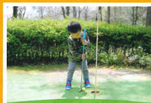
パットパットゴルフ