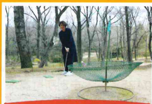
ターゲット・バードゴルフ