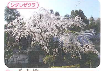
伽耶院 ●三木市志染町大谷410 P ●山陽道三木東ICから車で約5分