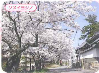
雲龍寺 ●三木市上の丸町9-4 P ●神戸電鉄三木駅から徒歩約10分