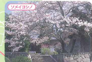
東光寺 ●三木市吉川町福吉261 P ●中国道吉川ICから車で約15分