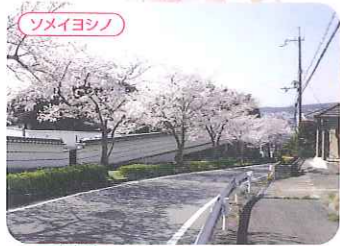
喜春公園周辺 ●三木市本町2丁目 P ●神戸電鉄三木駅から徒歩約10分