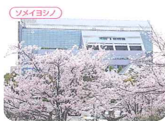
三木市役所前駐車場 ●三木市福井 P ●神戸電鉄三木上の丸駅から徒歩約10分