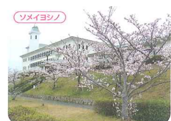
吉川総合公園 ●三木市吉川町西奥 P ●休園日：水曜 (水曜が祝日の場合はその翌日) ●中国道吉川ICから車で約10分