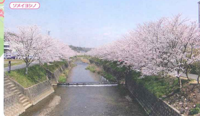
北谷川の桜づつみ ●三木市吉川町前田～古市 ●中国道吉川ICから車で約10分