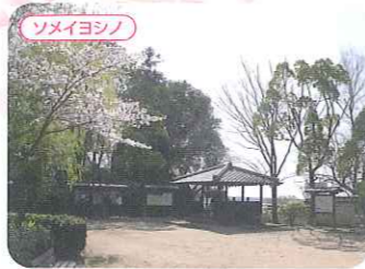
三木城跡 (国史跡) ●三木市上の丸町 P ●神戸電鉄三木上の丸駅から徒歩約5分