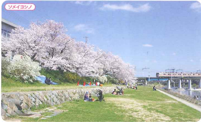
美霧川リバーサイドパーク ●三木市末広 (城山橋を中心に美霧川右岸) P ●神戸電鉄三木駅から徒歩約5分