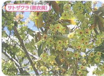
旧玉置家住宅 ●三木市本町2丁目2-17 P (観光協会横) ●神戸電鉄三木上の丸駅から徒歩約7分