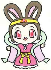
ねっぴ〜 ふるさと加西観光大使

播磨国風土記ゆかりの地 加西市と三木市を巡る共催ハイキングがスタート!! 播磨国風土記に記載がある「根日女物語」ゆかりの地を訪れます!