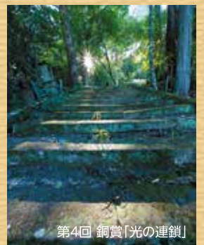
第4回 銅賞「光の連鎖」