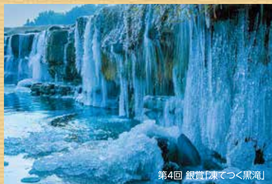
第4回 銀賞「凍てつく黒滝」