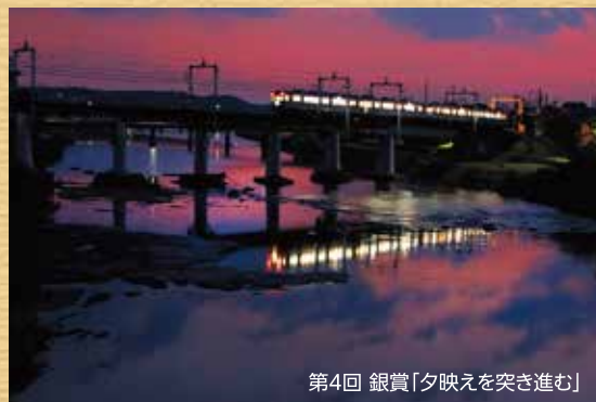
第4回 銀賞「夕映えを突き進む」