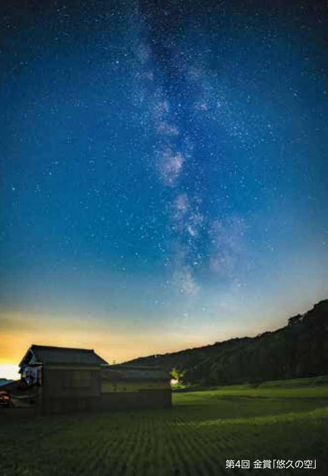
第4回 金賞「悠久の空」

※2022年1月1日(土)～2022年12月31日(土)までに 三木市内で撮影した写真に限ります。