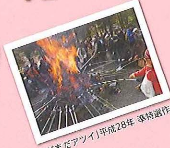
「まだまだアツイ」平成28年 準特選作品