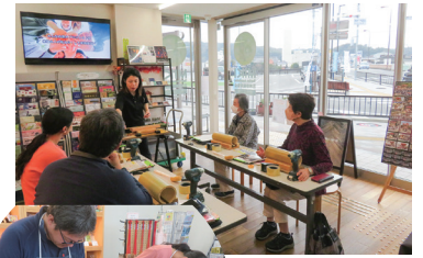
第1回 木工ドリルで 竹あかり作り