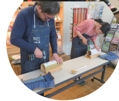
第2回 アロマセラピーで 香りのジェル作り